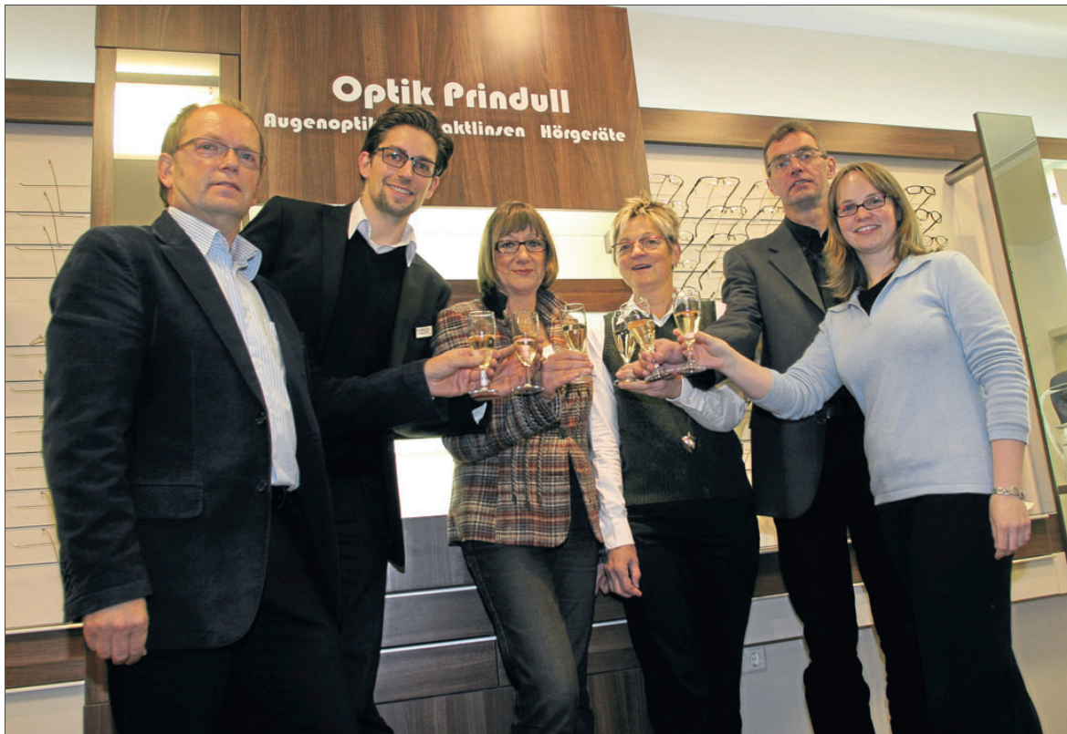
Auf die Zukunft: Das Team von Optik Prindull freut sich darauf, alle Interessierten und Kunden nun in den neu gestalteten und modernisierten Räumen begrüßen zu können.

Neben der kompetenten Beratung durch das freundliche Team – welches im Übrigen in Kürze